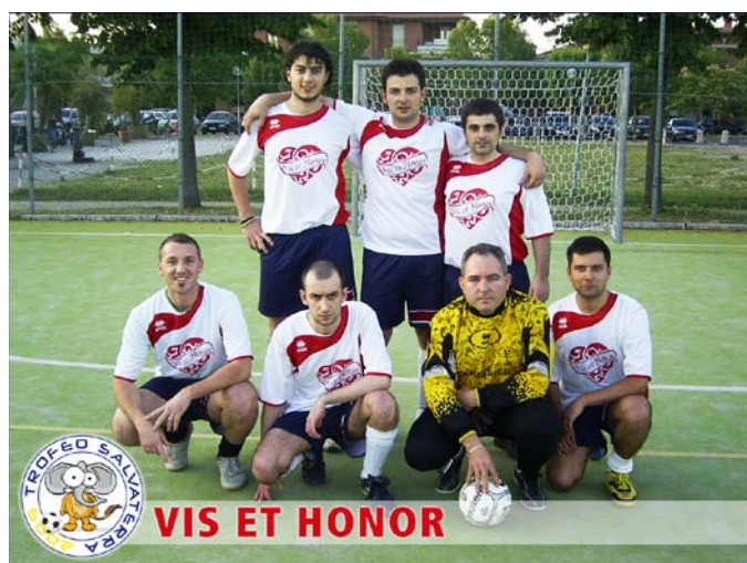
La Squadra Vincitrice del Trofeo Salvaterra di Calcio a 5

Dopo il buon successo ottenuto da questa I edizione il Comitato Provinciale di Reggio Emilia della ConfSport Italia è già al lavoro per l'organizzazione della II edizione che si terrà nel 2010.