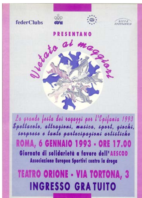
La prima locandina di "Vietato ai Maggiori" anno 1993

Anche per i "diversamente abili" sono state realizzate varie iniziative. I progetti hanno puntato decisamente sull'abbattere le barriere mentali, i pregiudizi e soprattutto l'indifferenza che spesso la nostra società frenetica innalza di fronte a chi non ce la fa a rimane indietro.