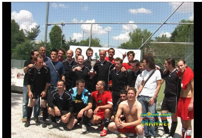
Premiazione del Campionato Regionale di calcio a 11

Coppe e medaglie per tutti in un clima festoso e di grande sportività con applausi e complimenti fra tutti i giocatori.