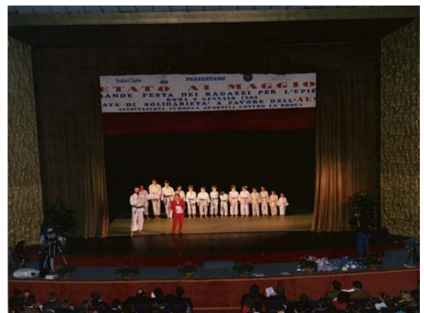
Un momento della manifestazione della I edizione