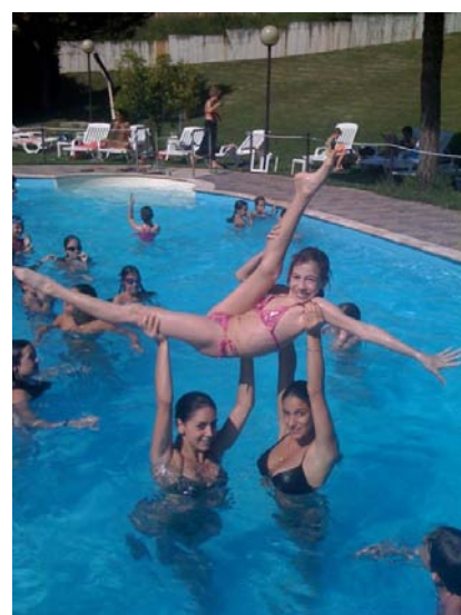
Le ginnaste in un momento di relax