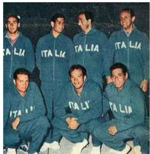
Carlo Pedersoli con la Nazionale Italiana

La vita è una e Carlo certo non può dire di non averla vissuta o di essersi perso un solo minuto di essa. Ovviamente aspettiamo e sue prossime mosse, perché conoscendolo da qui a poco lo ritroveremo immerso in qualche nuovo progetto.