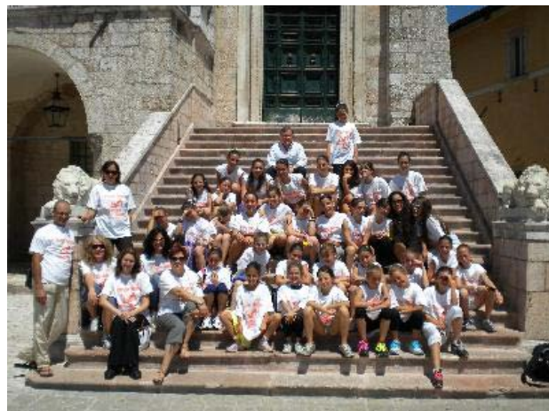
Foto di Gruppo