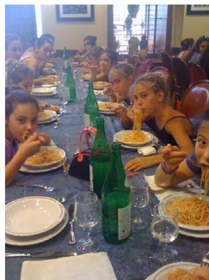
Le ginnaste davanti ad un bel piatto di ... carboidrati