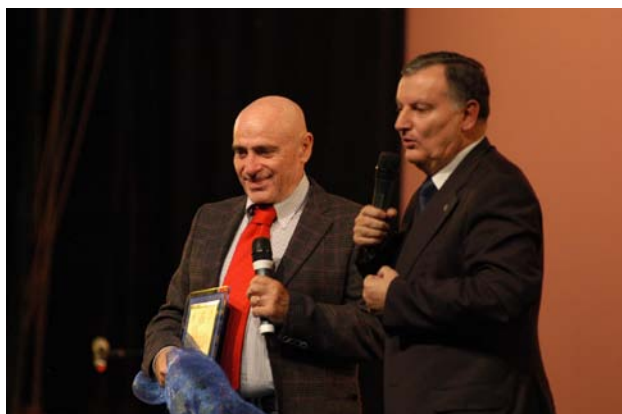
Il Presidente della Confsport Italia premia Edoardo Vianello