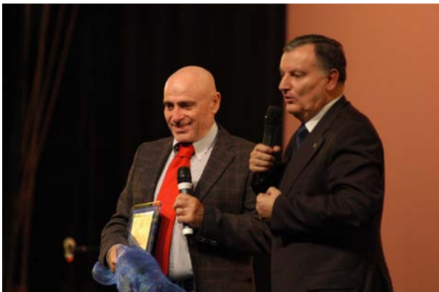
Il Presidente della Confsport Italia premia Edoardo Vianello