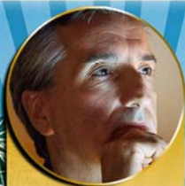
Fabrizio Angelini fra i più importanti Registi e Coreografi di Musical Italiani