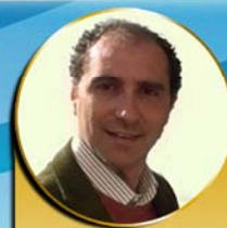
Giovanni Monti Ad oggi tra i più apprezzati compositori per il teatro già Direttore Musicale per la Compagnia della Rancia